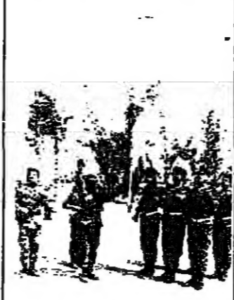
تقديم الاغرار الى العلم

احتفل معهد التعليم في خبيبة عند العاشرة من قبل ظهر امس بمناسبة الاول ازاغة الستار عن النصب التذكري لشهاده والثانية تقديم اغرار جد للعلم.